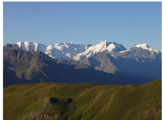
Sicht von der Es-cha-Hütte auf das Berninamassiv

Über einen spektakulären Trail geht es hinauf bis zur Es-cha-Hütte, wo die Aussicht auf die Engadiner Gletscher atemberaubend, die Luft aber bereits etwas dünner ist. Bergab ins Tal, können wir uns an einem langen, fahrtechnisch anspruchsvollen Singletail testen.