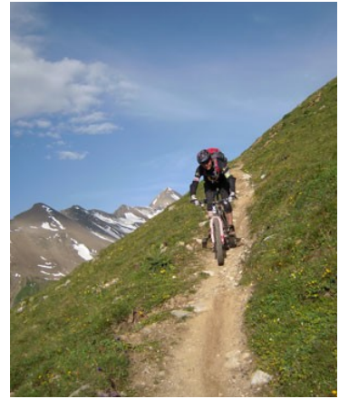
Abfahrt nach La Punt

Italien erwartet uns mit dem schillernden Lago del Monte, vorher müssen die Bikes jedoch etwa 20 min geschoben werden. Die anspruchsvolle aber geniale Abfahrt führt nach Livigno.