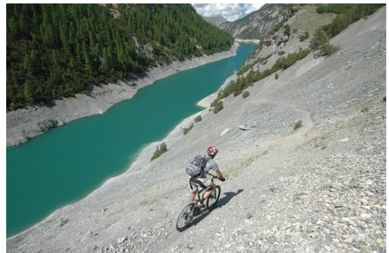
Single Trail am Lago di Livigno

Nach einem Aufstieg fahren wir hinab durch den Stelvio Nationalpark, vorbei am Lago di San Giacomo und erreichen wieder Schweizer Boden. Nach der Passhöhe Döss Radond erwartet uns etwas, das Biker-Herzen höher schlagen lässt: 850hm Downhillstrecke!