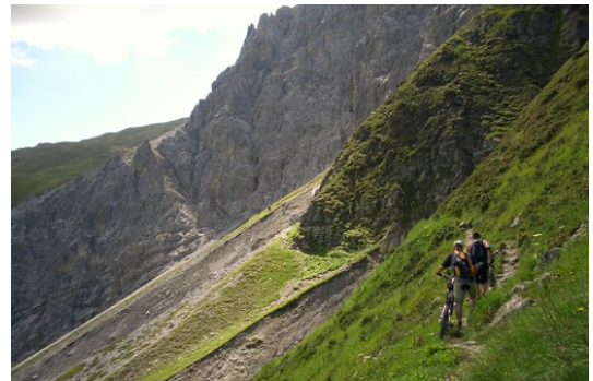
Kurz vor dem „Tritt“

Hinauf nach Medergen über den „Tritt“ nach Davos-Glaris; der „Tritt“ erfordert Kondition, technisches Können und Schwindelfreiheit. Oben erwartet uns ein 12km langer Höhenweg mit bestem Panorama. Dafür nehmen wir gerne ein paar Schiebepassagen in Kauf.