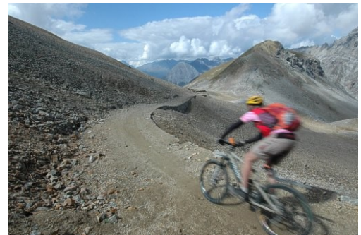
Abfahrt von der Bocchetta di Pedenolo

Über den Umbrailpass (auch mit dem Auto bezwingbar) fahren wir via Bocchetta di Pedenolo auf den Passo die Verva. Die lange Abfahrt kann man nochmals richtig geniessen, bevor wir die Tour entlang der Adda ausklingen lassen.